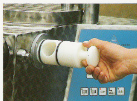
Der Abdrehschieber ist leicht herauszunehmen und beim Füllgutwechsel einfach zu reinigen.

wichtigen Informationen ablesen: Füllstand im Zylinder, Gewicht der Portionsgröße und die Zahl der Abdrehungen. Ermöglicht wird dies alles durch eine vollelektronische Steuerung, die auch härtesten Beanspruchungen gewachsen ist und einfachste Bedienung gewährleistet. Wie überhaupt bei dieser Maschine alles auf eine funktionsgerechte Arbeitsweise abgestellt ist: Dazu zählt zum Beispiel der auf jede Körpergröße bequem einstellbare Knieschalter, der beide Hände zum Arbeiten freiläßt. Der Abdrehschieber der einfach herauszunehmen und leicht zu reinigen ist. Das mit Knopfdruck und Überwurfmutter schnell zu wechselnde Füllhörnchen oder auch die moderne Form des Füllautomaten mit den glatten NIROSTA-Flächen und der dadurch einfachen Reinigung. Ebenfalls aus NIROSTA-Material ist der Brätzylinder. Der leichte Kolben ist aus nichtrostendem Metall.