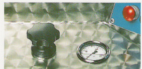
Die Geschwindigkeits- und die Druckregelung erfolgt über einen stufenlosen Regler.