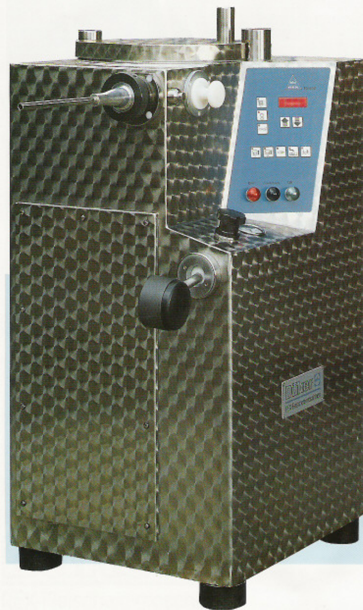
Die Maschine entspricht den Vorschriften der Berufsgenossenschaft.