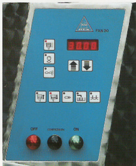
Das Tastenfeld für die Bedienung ist mit leicht erkennbaren Symbolen übersichtlich angeordnet.